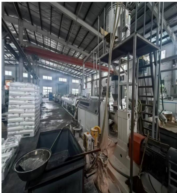
图 1 涉事生产线

30 米（图 1）；投料的框为铁皮制，长约 1.8 米，宽约 1 米，深约 0.6 米，原料投入铁框添加完干燥剂后由真空吸泵将物料从铁框内吸入热熔设备；吨袋为编织袋，有 4 个吊运口用于连接索具，底部有放料口；用于吊运的索具三股锦纶绳有断裂痕迹（图 2）。